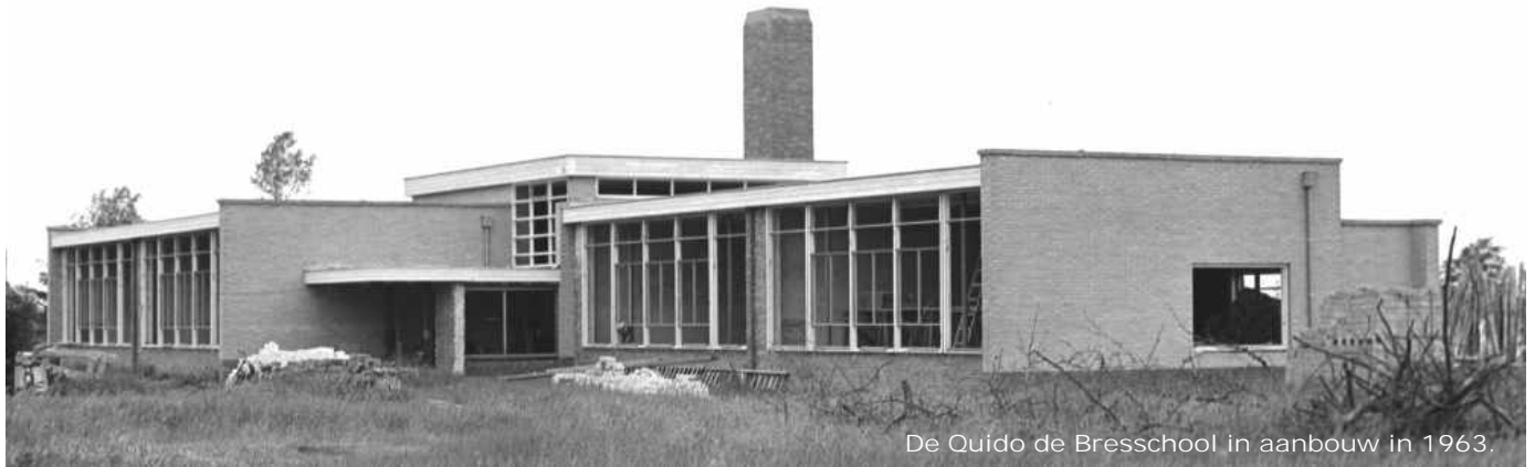
De Quido de Bresschool in aanbouw in 1963.

- Op 17 oktober 1963 wordt de Quido de Bresschool officieel in gebruik genomen.