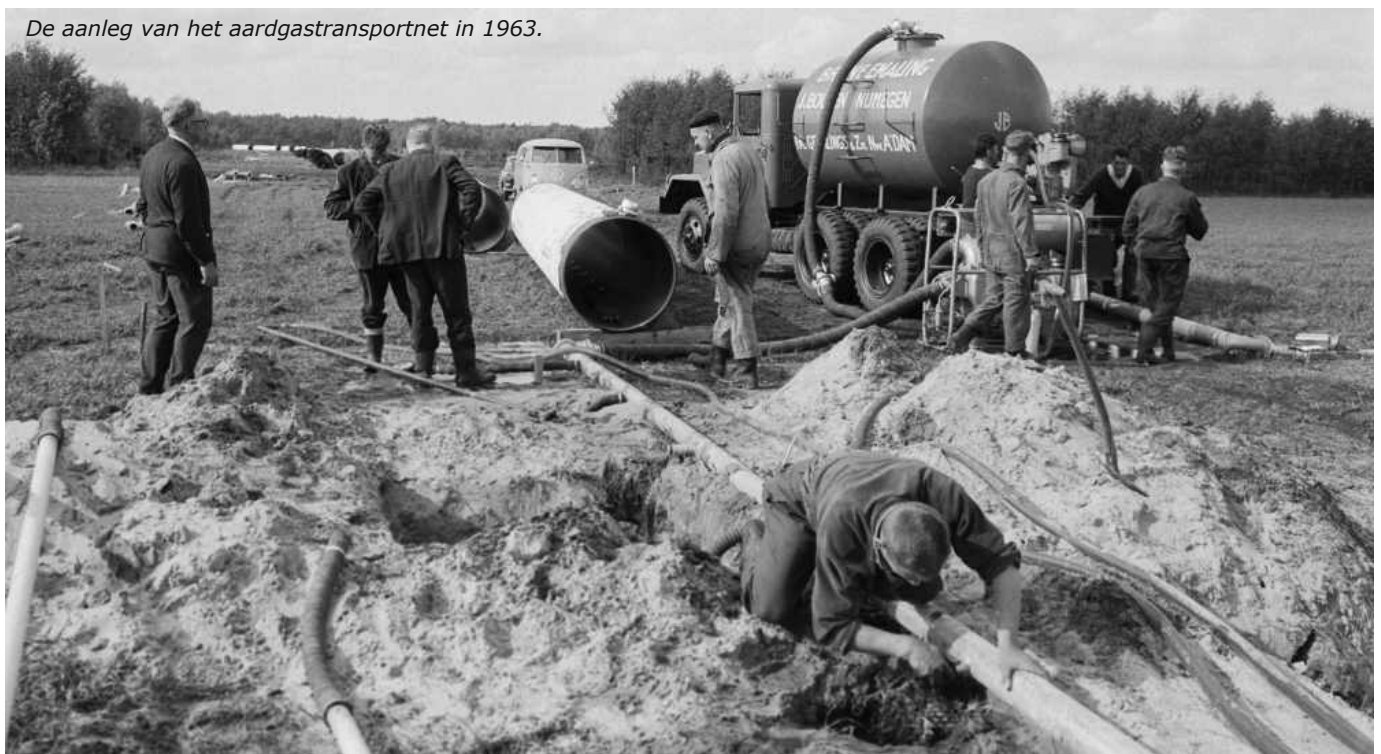
De aanleg van het aardgastransportnet in 1963.

- De N.V. Ned. Gasunie zoekt t.b.v. de aanleg van een aardgastransportnet door Nederland o.m. een kantoor te Ommen. Het Gemeentebestuur heeft daartoe het gebouw Kruisstraat aangeboden voor f 3500,- per jaar, waarmee de Gasunie akkoord gaat. De huidige gebruikers van het gebouw zijn in andere gebouwen ondergebracht.