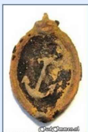
Afb. 14 horlogesleutel