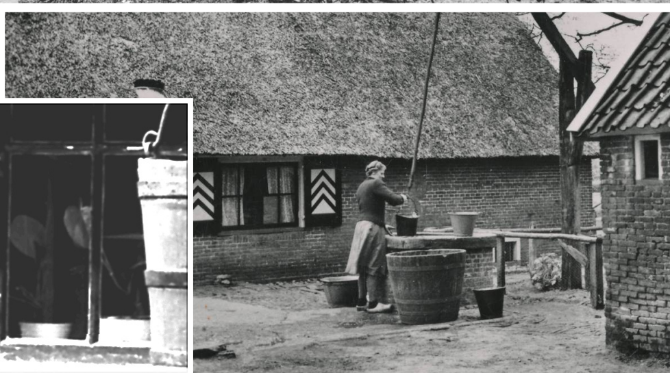
Vilsteren, Boerderij Borrink