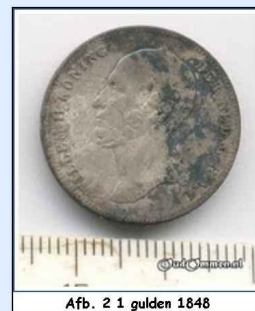
Afb. 2 1 gulden 1848