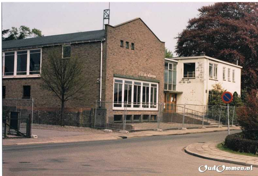
De Olde Wheeme vlak voor de afbraak in 1987