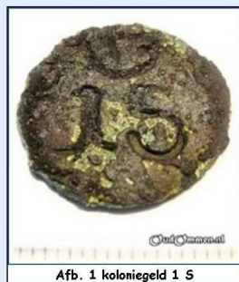
Afb. 1 koloniegeld 1 S