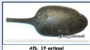
Afb. 19 eetlepel

Enkele voorbeelden van bodemvondsten uit de Ommerschans