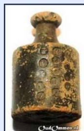
Afb. 15 knopgewicht