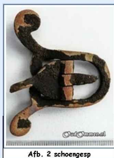
Afb. 2 schoengesp