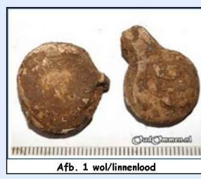
Afb. 1 wol/linnlood