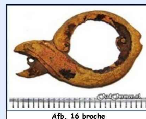
Afb. 16 broche