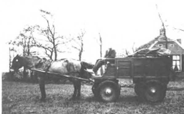
Venter van Kruidenier Keizer aan het Ommerkanaal

Namen in dit verhaal komen spontaan op uit het brein van de schrijver. Enige gelijkenis met bestaande personen berust dan ook op louter toeval.