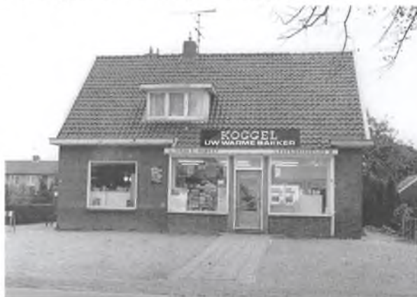
1980: Bakkerij Koggel aan de Hardenbergerweg