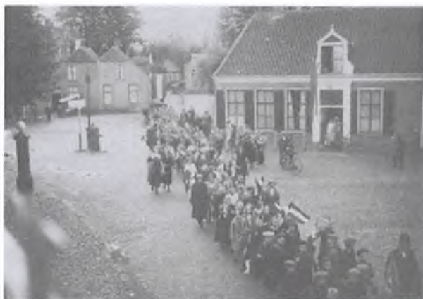
1925: Volksfeest. Kinderoptocht in de Voorbrug. Op deze foto komt de oude situatie in de Voorbrug duidelijk naar voren.