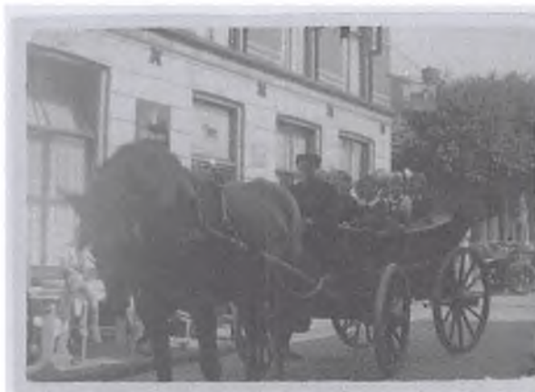
Deel van een schoolreisje uit 1940 in de Kruisstraat bij Het Zwarte Paard, zie het raam boven de deur en het uithangbord aan de hoek van het Hotel.

"Bussummer" houdt kennelijk van gezelligheid, hij hijst zich in de kleren en begeeft zich naar het vrolijke volk. Daar hoort hij dat de kinderen van een schoolreisje zijn thuisgekomen en het plaatselijke zangkoor hen feestelijk heeft ingehaald.