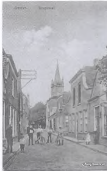
De Brugstraat in de tijd dat er veel armoede was.

Ten gevolge van de Franse overheersing werd ons land zeer arm. Zo rond 1816 leden veel inwoners aan ellende en ontbering. Met het oog op de precaire staat van de staatskas, konden toen alleen mensen geholpen worden die geen lid waren van de kerk. De kerk van Ommen had het met haar eigen armen al moeilijk genoeg. Dominee van Raalte, voorganger van een groep afgescheidenen, ondernam zelfs pogingen om enige verlichting van de armoede te brengen door de stichting van een pottenbakkerij en de oprichting van een steenfabriek. Deze bedrijfjes hebben echter niet zo heel lang gefunctioneerd en zijn enige tijd later weer opgeheven. De tijden van toen zijn niet te vergelijken met de armoede van nu maar toch. Ook nu leven er weer veel mensen in armoede en ellende. Vanaf 1965 kwam er een behoorlijke verbetering met de invoering van de 'Algemene Bijstandswet' door de toenmalige minister van sociale zaken mevrouw Marga Klompé.