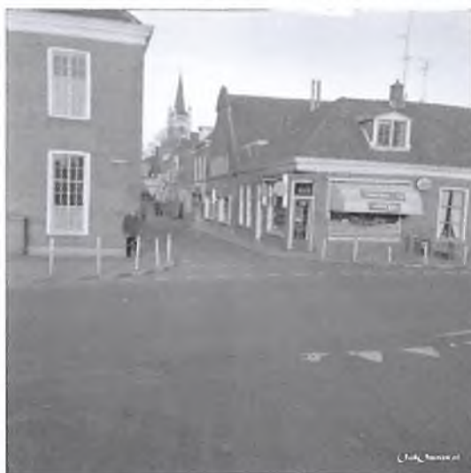
Horlogemaker Van der kolk

De vrachwaangs van Stegeman reed'n nog deur de Brugstroate, kujt oe nog veurstel'n ? Nee, ie blijft maar mooi rustig op oew stoel zitten, maar in gedag'n kuiert wiej mooi eempies deur Omm'n. De Brugstroate, of zoas het vrogger nuumt wurd'n; Bruggestroate of Grotestroate, is de oalste stroate van Omm'n.