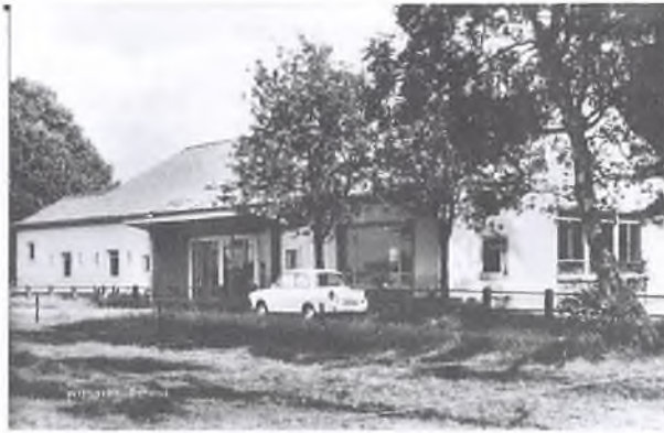
School in Witharen