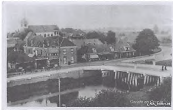
Het aardige pand wordt in 1969 afgebroken en daarmee gaat de vriendelijke entree van Ommen verloren.

De grote staatsman Pieter Jacobus Oud heeft Ommen niet vergeten. Dit blijkt uit bezoeken, die hij een groot aantal jaren na zijn verhuizing naar 's-Gravenhage aan onze stad heeft gebracht. Door die bezoeken kon het raadsel van De Zevensprong op de Brink in Ommen worden opgelost.