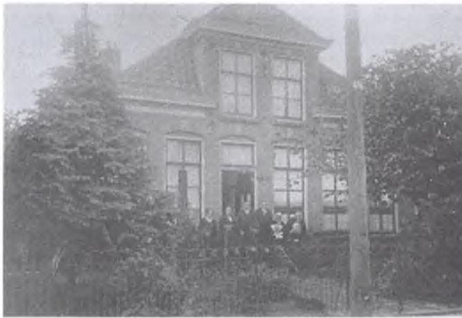
Het Oude Mammen- en Vrouwenhuis aan de Gasthuisstraat

Ook na de Reformatie bleef de kerk de hulpverlening aan arme mensen voortzetten. Maar na deze tijd nam ook de bemoeienis van het stadsbestuur toe bij de bestrijding van de armoede onder de bevolking van Ommen. Vooral in grote nood sprong het stadsbestuur bij. Zelfs in de eerste helft van de vorige eeuw bleef het voor velen een armoedig bestaan, dat nog extra vergroot werd door misoogsten van bijvoorbeeld de aardappelverbouw. Deze werd veroorzaakt door een geheimzinnige ziekte aangeduid als de zwarte ziekte met de naam