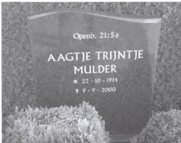
Juffrouw Mulder ligt begraven op begraafplaats Laarmanshoek in Ommen.

Als pensionado verhuisde mej. Mulder nog enkele keren. De laatste jaren van haar leven waren qua gezondheid niet gemakkelijk. Op 1 april 1999 kwam de vroegere onderwijzeres te wonen in bejaardentehuis Oldenhaghen in Ommen. Daar overleed ze op zaterdag 9 september 2000. Aagtje Trijntje Mulder werd begraven op begraafplaats Laarmanshoek in Ommen.