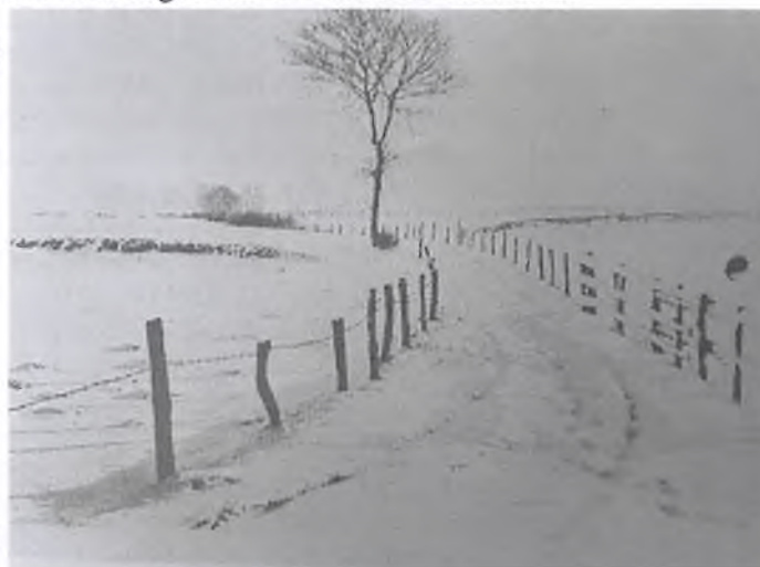
Foto van de zandweg langs de Bollemaat, nu de Doormanstraat