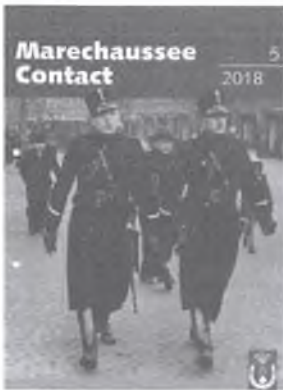
* KMar - Koninklijke Marechaussee