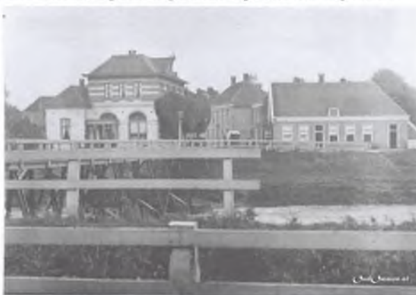
1910. De oude ophaalbrug over de Vecht, met houten leuning. Het ophaalgedeelte zelf is niet zichtbaar op de foto. Zicht vanaf de noordoever van de Vecht op de Voorbrug, zoals gezegd 'vóór de brug' die naar het centrum ging met de Brugstraat. In beeld ook Hotel "De Zon". In het midden de marechausseekazerne en rechts de Zwolseweg.

De rivier de Vecht slingert vanaf Duitsland door een prachtig natuurlijk dal dat hij zelf geschapen heeft. Als kleinste van onze grote rivieren verbindt de Vecht Ommen met Hardenberg en Dalfsen. De Vecht was vroeger ook verbonden met de binnenstad van Zwolle. De rivier heeft tot ver in de 19e eeuw, een belangrijke rol gespeeld in de scheepvaart. Ooit werd over de rivier het volgende geschreven: "Veel vertier schenkt deze stroom aan de stad door de scheepvaart en veel levendigheid door het gestadig op- en afvaren van schuiten, terwijl zij tevens de gelegenheid aanbiedt om de tafel der Ommers van riviervisch te voorzien, daarbij in het voorjaar ook nog, wanneer het water niet al te laag is, de spiering aanvoerende, die voor aangenamer van smaak gehouden wordt als die welke men in den IJssel vangt".