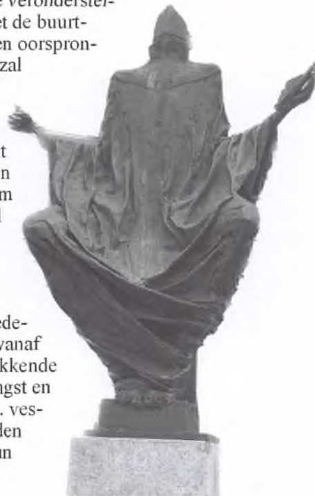
In 1998 bij de viering van Ommen 750 jaar stadsrechten werd een standbeeld van bisschop Otto III op het Vrijthof geplaatst als herinnering dat hij in 1248 Ommen stadsrechten verleende.

Over de Slag bij Ane van 1227 is bekend dat bij het bisschoppelijke leger ook ridders meevochten die afkomstig waren uit Beerze en Stegeren. Uit Stegeren, wonende op Erve Praestinck gaat het om de familie Van Steijgeren. De buurtschap zou later naar hen vernoemd worden. Een oorkonde uit 1240 zegt dat een stuk land in de bocht van de Vecht onder Stegeren geschonken wordt aan het Zwartewatersklooster in Hasselt. Niet wordt uitgesloten dat hier de vermoorde mannen van de Slag bij Ane tijdelijk zijn begraven of