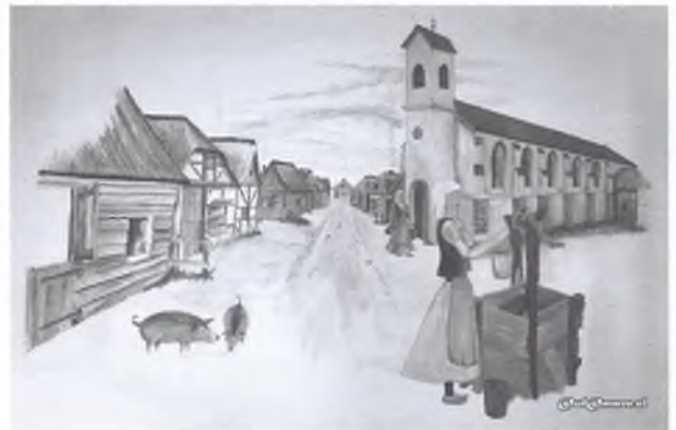
Zo moet ongeveer de kerk in Ommen er in de middeleeuwen hebben uitgezien. Ommen was klein en compact. Huisjes en boerderijtjes, vaak van hout met stro- of rieten daken, maar de kerk van steen. Dit naar een idee en tekening van Luuk Vogelzang.

Bijzonder is verder de ongeveer uit het jaar 1150 afkomstige Romaans doopvont, gemaakt van Bentheimer zandsteen. Weliswaar in 1903 verkocht aan het Rijksmuseum, maar gelukkig was er later weer historisch besef, want in 1979 kon via een bruikleenovereenkomst het doopvont weer terug naar de kerk in Ommen.