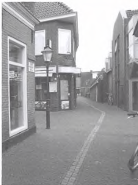
De plek (Brugstraat/De Poffert,) waar ooit de Bruggepoort stond met de stadsmuur, is hier gemarkeerd met een lijn in de bestrating.

Oorspronkelijk is Ommen een nederzetting nabij een doorwaadbare plaats in de Vecht. De geschreven geschiedenis is na te gaan tot ongeveer het jaar 1200. De naam "Umme" wordt al vermeld in 1133. Het stadsrecht werd in 1248 verleend door Bisschop Otto III. Wie de plattegrond van Ommen bekijkt valt duidelijk de ronde vorm op van het stadje. Vrij nauwkeurig is na te gaan waar de oude stadswallen hebben gelegen en op welke plaatsen de Bruggepoort, de Varsenerpoort en de Arriërpoort hebben gestaan. Op de plek van de Arriërpoort is nog altijd een grote kei te vinden waarin de deur van poort zou hebben gedraaid. Op de poorten waren hokken getimmerd, waarin de stad duiven hield.