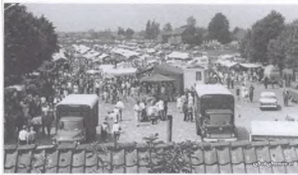
1952: grote drukte op de Ommer Bissingh

varkensmarkten in Overijssel. Elke boer uit de omgeving bezocht de markt om niet alleen te handelen maar ook om elkaar te ontmoeten. De klompen werden voor die boerenzondag schoon geschuurd en men hees zich in het beste pak. Deze markt werd dan ook wel Boerenzondag genoemd, Behalve handel werd de markt later ook een groot toeristisch trekpleister. Marktkraampjes met (boeren) gereedschap, touwen, werkkleding en klompen maar ook kramen met (gebakken) vis of leverworst comple-