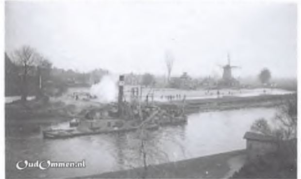
1900. Met een baggermolen wordt met zand uit de Vecht de oude haven gedempt. Op de achtergrond molen Den Oord.

Het lidmaatschap van de Hanze had de stad uitsluitend te danken aan haar strategische ligging aan de Vecht, indertijd een belangrijk vaarwater voor transport van bijvoorbeeld Bentheimer zandsteen uit het Duitse achterland. Zo is het paleis op de Dam in Amsterdam steen voor steen langs Ommen gevaaren. Ook werd Silezisch linnen en Westfaals katoen over de Vecht vervoerd richting Zuiderzee naar het koopgrage Westen of naar steden als Zwolle, Kampen en Hasselt om overgeladen te worden op koggeschepen, die de waren verder vervoerden. Daarbij moet overigens wel worden opgemerkt dat de kronkelde Vecht niet vlot bevaarbaar was. Een retourvaart Ommen-Zwolle duurde zes dagen.