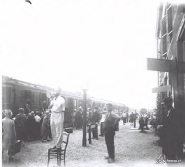
1928. Station Ommen. Duizenden volgelingen van Krishnamurti van over heel de wereld vervoerden zich per trein naar de Sterkampen in Ommen

In 1921 bracht Krishnamurti op uitnodiging van baron van Pallandt een bezoek aan het landgoed Eerde. Bij deze gelegenheid bood Van Pallandt hem het landgoed Eerde aan met ook de Besthmenerberg. Na aarzelen besloot Krishnamurti (die geen persoonlijke eigendommen wilde hebben) op het aanbod in te gaan met dien verstande dat de bezittingen ondergebracht werden in de “Eerde Stichting”. Van Pallandt was inmiddels toegetreden tot de Theosofische Vereniging en de Orde van de Ster van het Oosten. In 1923 werd door baron van Pallandt het kasteel met de bijbehorende bossen, heide en akkers overgedragen aan de Orde van de Ster in het Oosten met Krishnamurti als voorzitter van de in het leven geroepen Eerde Stichting.