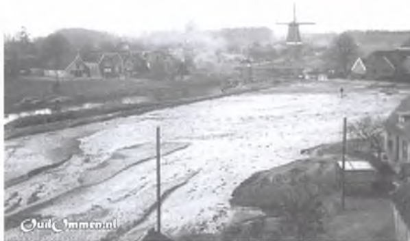
1900. De gedempte Borggraven. Op de achtergrond links de Voorbrug en rechts de Konijnenbeltmolen aan de Zwolseweg.

Zoals gezegd had Ommen gedurende de Hanze periode geen echte haven. Een gedeelte van een oude Vechtarm deed dienst als haventje: Borggraven. Zo genoemd omdat bij onstuimig weer de schepjes daar tijdelijk “geborgen” konden worden. De Borggraven was tevens de thuishaven voor de Ommer Vechtbevaarders. De tegenwoordige straatnaam “Burggraven” herinnert nog aan de dagen van weleer. De Burggraven heeft ook gediend tot een deel van de stadsgracht.