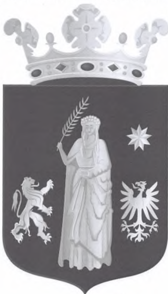
Het stadswapen van de gemeente Ommen toont de heilige Brigida, patrones van Ierland.