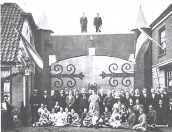
1948. Bij de viering van 700 jaar stadsrechten hebben bewoners van de Bouwstraat/Bouweinde de Arriërpoort nabehouwd op de plek waar deze ooit heeft gestaan.

De huizen waren van hout en met riet of stro gedekt. Brandspuiten waren er niet en brandwaarborgmaatschappijen evenmin. Alleen de kerk, het stadhuis, de Doelen en enkele aanzienlijke woningen waren van steen. Door de bemuurde stad stonden huizen dicht op elkaar. Daarom dat doelmatige bepalingen regelden dat de zindelijkheid op de straten in acht genomen moest worden. Op bepaalde plekken mocht men geen meshopen maken. Wie zich er niet aan hield werd bekeurd. In het Pijeshues konden zekere natuurlijke