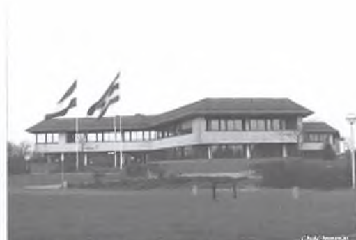
Het oude gemeentehuis aan de Markt en het nieuwe gemeentehuis aan de Chevallereastraat.