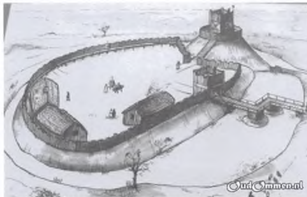
Een mooi voorbeeld van een motteburcht. Een ronde ringburcht, gebouwd in de 12e eeuw. De ringburcht is hoog gelegen op een motteheuvel met een lager gelegen voorburcht.

Kort na 1215 verzamelde de bisschop van Utrecht, Otto II, hier zijn troepen om de Drenten onder leiding van Rudolf van Coevorden te bestrijden. Maar de bisschoppelijke troepen werden verslagen. Doch bisschop Otto liet dat er niet bij zitten en vanuit Ommen zou opnieuw een aanval gedaan worden op de Drenten. Daartoe verzamelde hij in 1227 in Ommen een grote legermacht voor de Slag die de geschiedenisboeken in ging als de 'Slag bij Ane'. Op 28 juli 1227 werd het bisschoppelijk leger bij Ane totaal verslagen en de bisschop op gruwelijke wijze afgemaakt.