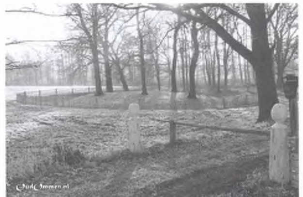
Plek van de kasteelmotte aan de Zwolseweg, tussen de Regge en de Vecht, een burcht met daarop een toren om de Drenten tegen te houden. Helaas is het "kasteel" eeuwen geleden verloren gegaan en rest alleen nog de motteheuvel.

Na verlening van het stadsrecht in 1248 werd de stad Ommen omringd met muren, wallen en poorten. Buiten de wallen was om de stad een gracht gegraven, die in verbinding stond met de Vecht. Aangenomen wordt dat het ging om houten vesten en omheiningen. De eerste schermutseling waar de stad Ommen mee te maken kreeg was op 9 mei 1330 als een troepenmacht Ommen binnenvalt. De heren van Rechteren en van Voorst voerden een oorlog tegen Bisschop Jan van Diest, waarbij Ommen het middelpunt van het krijgsumroer werd. Huizen werden in brand gestoken en alle vesten en muren met de grond gelijkge maakt. Het ontbrak de bisschop aan geld om de muren weer te laten opbouwen, want de stad bleef jarenlang ontmanteld.