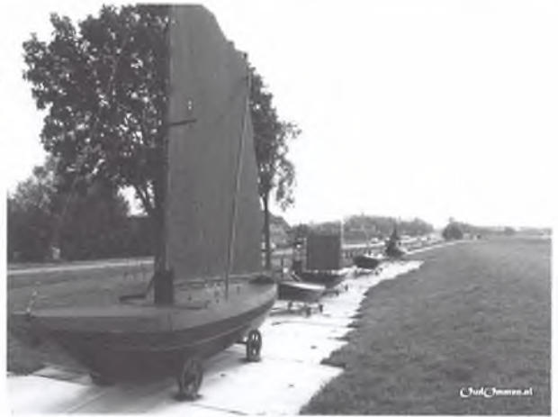
"Boten" langs de Hessenweg en Vecht markeren een historisch weg- en waterknooppunt tussen Ommen en Zwolle. Het zijn als het ware ziele-schepen, een onderdeel van het kunstproject 'Kunstwegen'.

Belangrijke zijrivieren die zich bij de Vecht vanaf de bron in Duitsland voegen zijn de Steinfurter Aa, de Dinkel en iets voorbij Ommen de Regge. Belangrijke plaatsen en dorpen langs de Vecht zijn: Metelen, Wettringen, Schüttorf, Brandlecht, Nordhorn, Neuenhaus, Hoogstede, Emlichheim, Gramsbergen, Hardenberg, Ommen, Vilsteren/Oudleusen, Dalfsen en Zwolle. Via de Vecht werden de uit de rotsen van Bentheim gehouwen zandstenen blokken naar Zwolle geëxporteerd om hier te worden overgeladen op grotere schepen via de Zuiderzee naar het westen. Al sinds de 11e en 12e eeuw wordt er in het graafschap Bentheim zandsteen gedolven.