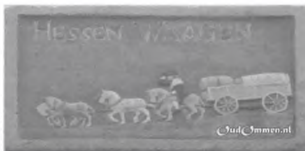
Als herinnering aan de Hessense kooplieden is een gevelsteen 'Hessenwaagen', aangebracht in de muur van de voormalige Hessenherberg in de Thomas a Kempisstraat in Zwolle.

De voermannen reden in een bijna rechte lijn vanaf Duitsland langs Hardenberg, Ommen en Dalfsen naar Zwolle en verder. Alle Hessenwegen liepen op ruime afstand langs de dorpen en steden. Een belangrijke reden hiervoor was dat de Hessenwagens een veel bredere spoorbreedte hadden dan de gangbare wagens en karren in Nederland. De afwijkende wagens zouden het karrenspoor van de gewone zandwegen stuk rijden.