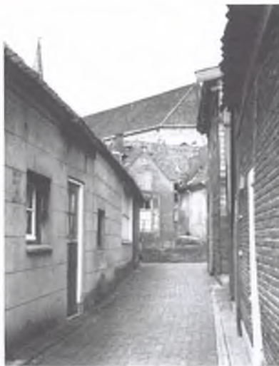
1968: zijstraatje van de Burggraven

In 1465 kreeg Steven van den Clooster toestemming om een "Spiker" te bouwen tegen de buitenmuur van de stadsmuur. De spiker was eigenlijk een klein kasteeltje. De bewoner van de spiker moest in oorlogstijden de stad helpen verdedigen tegen aanvallen. Daarvoor moesten twee oorlogswerktuigen in de gebouwen voorhanden zijn: een laatbusse en een knijpbusse. De gracht rond het kasteeltje van Steven van den Clooster was de Burggraven.