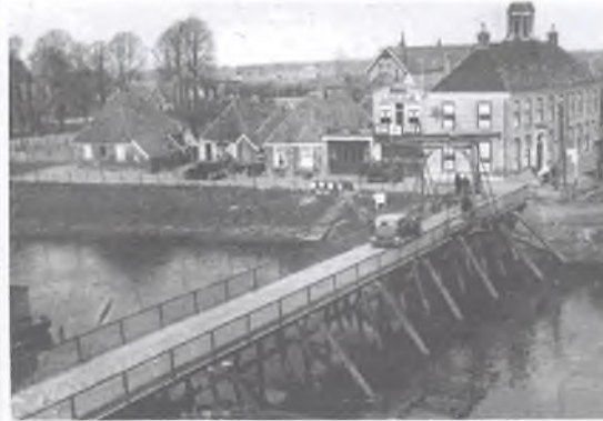
Het gemeentehuis van Ommen. De linker foto is uit 1899. De rechter foto uit 1936.

ter op de woensdagen. Traditioneel als Ommen is wordt aan de vooravond van de jaarmarkt zelf, op de maandag er voor, de officiële openingshandeling gehouden met het luiden van de eeuwenoude bissinghbel.