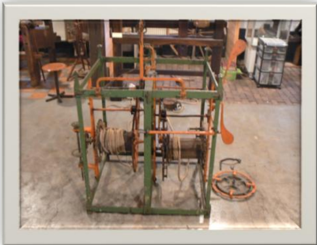
Voor de restauratie