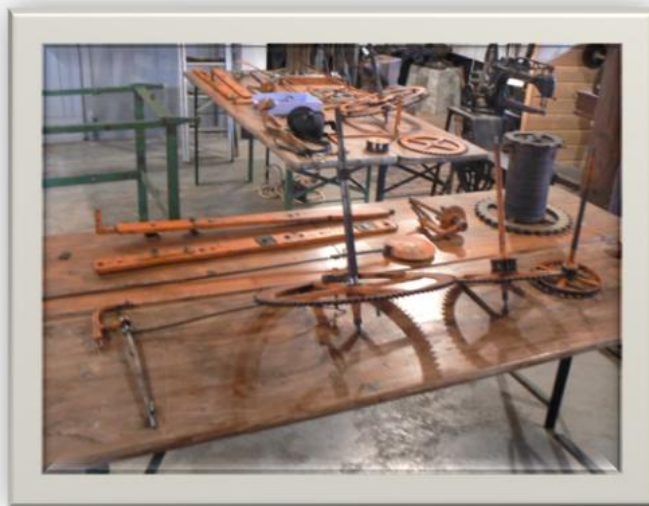
Tijdens de restauratie

Dit torenuurwerk stamt uit de 16e eeuw en heeft tot midden 20ste eeuw dienst gedaan in de Nederlandse Hervormde Kerk aan de Brugstraat in Ommen. In 1918 werd deze klok voorzien van een kleine wijzer. Hiervoor beschikte deze klok maar over één wijzer en gaf dus alleen de uren aan.