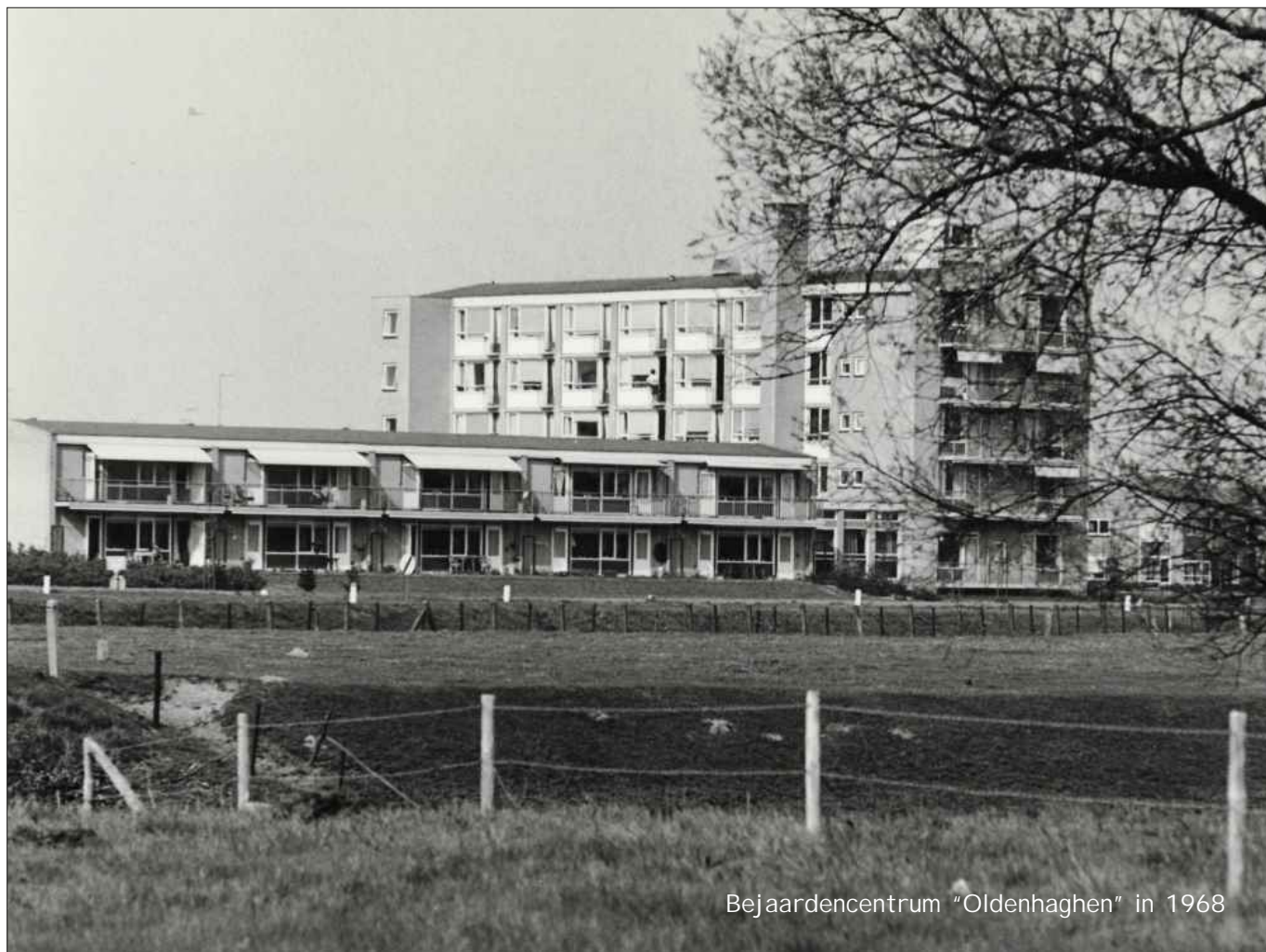
Bejaardencentrum "Oldenhaghen" in 1968

Op 15 juli 1961 wordt het bejaardencentrum "Oldenhaghen", bevattende 48 éénpersoons, 10 tweepersoons kamers en 10 flatjes, in gebruik genomen.