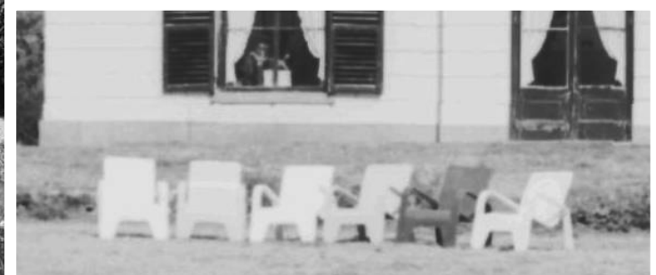
Huize "Olde Vechte", van 1 januari 1959 tot 1 oktober 1966 verhuurd aan J.F. Boddeus, exploitant vakantieoord "Olde Vechte".