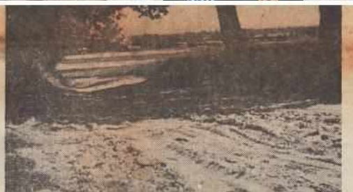
• Met opmerkingen in de re...

komst en optatime van de toer- tenbelasting. De heer Van der Boon lijkt aldus voor niets te zijn opgestapt na tien jaar trouw- dienste. Ondanks alle moeilijkhe- den is de VVV van Ommen bij elkaar gebleven en zo wil men het ook. De VVV is altijd bijzonder zuinig op de doorgaans inactieve leden geweest. In het verleden is het zelfs voorgekomen dat een lid, dat de hem opgelegde contributie te hoog oordeelde en simpelweg de helft gireerde, de rest is kwijt- gescholden om hem toch vooral niet kwijt te raken. De Ommer VVV is aan een nieuw hoofdstuk begonnen. Of zij ook een nieuw gezicht zal krijgen moet maar worden afgewacht.