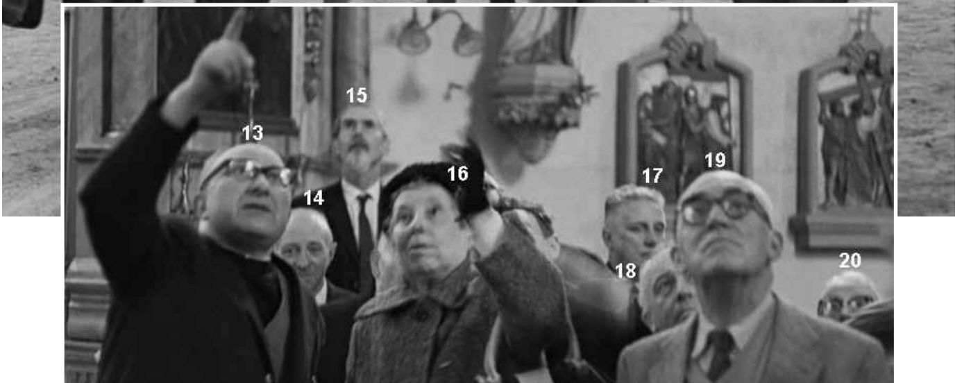
Excursie Gemeenschap Oll'Ommer op 16 mei 1963