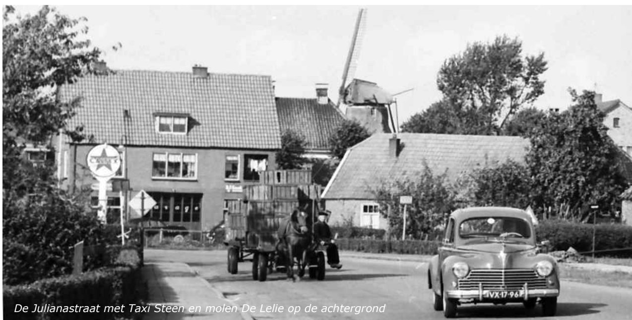
De Julianastraat met Taxi Steen en molen De Lelie op de achtergrond