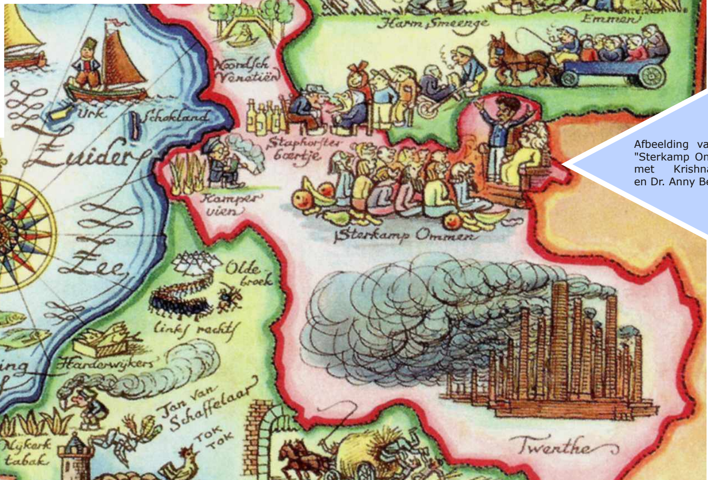
Afbeelding van het "Sterkamp Ommer" met Krishnamurti en Dr. Anny Besant