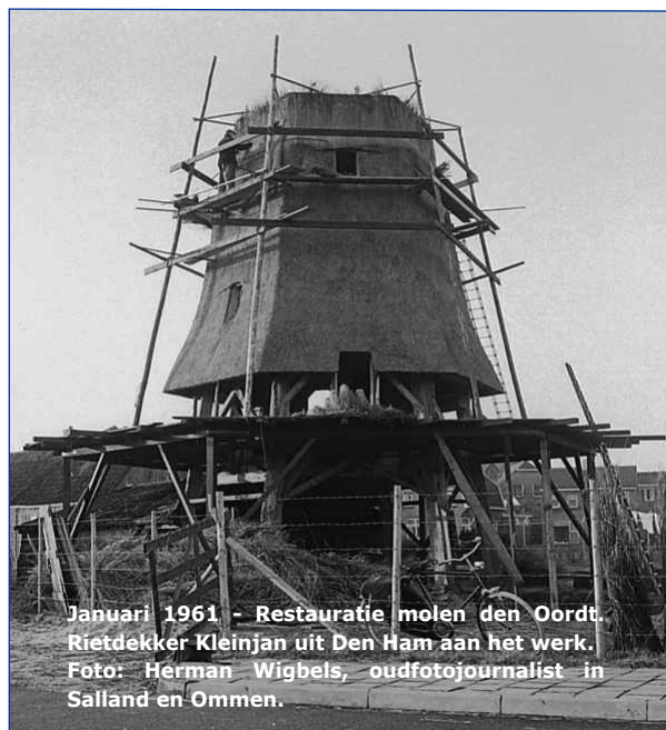
Januari 1961 - Restauratie molen den Oordt. Rietdekker Kleinjan uit Den Ham aan het werk.